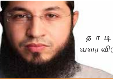
தாடியை வளர விடுதல்.