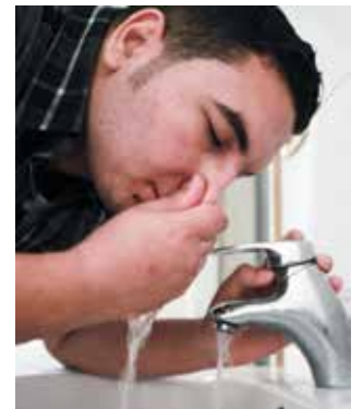
நாசிக்கு நீர் செலுத்துதல்