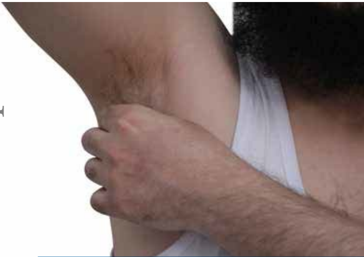
அக்குள் முடிகளை அகற்றுதல்

இது அக்குள் பகுதிகளில் உள்ள முடிகளை அகற்றுவதை குறிக்கின்றது. இதன் மூலம் துர்நாற்றம் போன்ற விடயங்களில் இருந்து துப்பரவாகிக் கொள்ளலாம்.