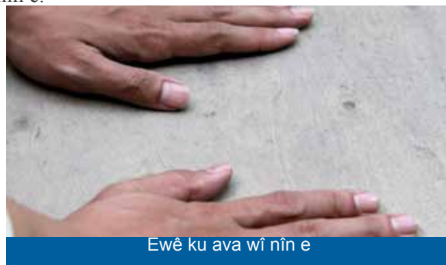
Ewê ku ava wî nîn e

Heta însan li avê negere, nayê hesabkirin ku av nîn e.