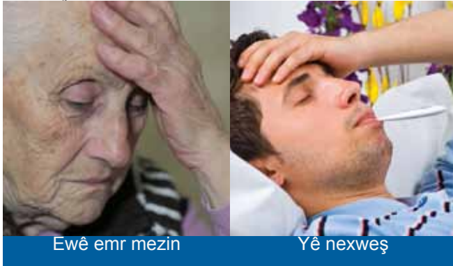
Ewê emr mezin

Her wekî yê nexweş û ew yextiyarê ku nikare tevbigere û li cem wî jî kes nîn e, ji bo desmêjê arîkarîya wî bike.