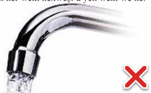
Hebûna avê ye