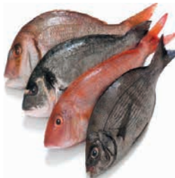
يجوز صيد البحر