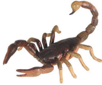
يجوز قتل العقرب

كالتقبيل واللمس؛ لأنه وسيلة للجماع وهو من محظورات الإحرام.