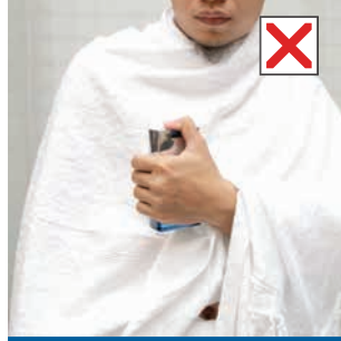
تطيب الثوب للمُحْرِم