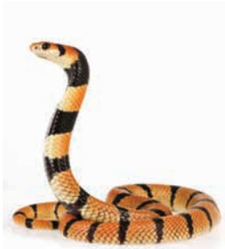
يجوز قتل الحية

لقوله تعالى: ﴿لَا تَقْتُلُوا الصَّيْدَ وَأَنْتُمْ حُرْمٌ﴾ [المائدة: ٩٥]، أي: وأنتم محرمون بالحج والعمرة، وقوله تعالى: ﴿وَحَرَّمَ عَلَيْكُم صَيْدُ الْبَرِّ مَا دُمَّتُمْ حُرْمًا﴾ [المائدة: ٩٦]. والمراد بصيد البر: ما كان وحشياً مباحاً من الحيوانات أو الطيور. أما الحيوان المستأنس فليس بصيد، فيجوز للمحرم ذبح الدجاج وبهيمة الأنعام ونحوها؛ وأما صيد البحر فجائز، لقوله تعالى: ﴿أَجَلٌ لَكُمْ صَيْدُ الْبَحْرِ وَطَعَامُهُ﴾ [المائدة: ٩٦] وأما الحيوان الذي يجرم أكله كالحية والعقرب فيجوز قتله، ويجوز للمحرم قتل كل حيوان اعتدى عليه إذا لم يستطع دفعه إلا بذلك.