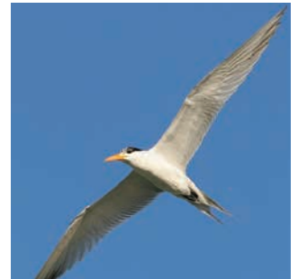
يجرم صيد البر من الطيور