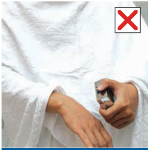
تطيب البدن للمُحْرِم

فيحظر على المحرم أن يطيب بدنه أو ثوبه بعد دخوله في الإحرام، أو يقصد شمه؛ لحديث ابن عمر رضي الله عنهما السابق وفيه: «وَلَا تَلْبَسُوا مِنَ الثِّيَابِ شَيْئًا مَسَّهُ الرَّعْفَرَانُ وَلَا الْوَرَسُ» (١) (متفق عليه) ولحديث الذي مات محرماً فقال: «وَلَا تُحْنَطُوهُ» (٢) . (رواه البخاري).