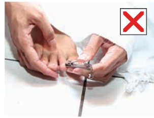
تقليم أظفار القدمين للمُحْرِم