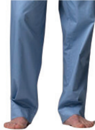
لِبْسُ السَّرَاوِيلِ لِلْمُحْرِمِ