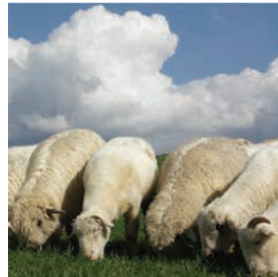
يجوز ذبح بهيمة الأنعام