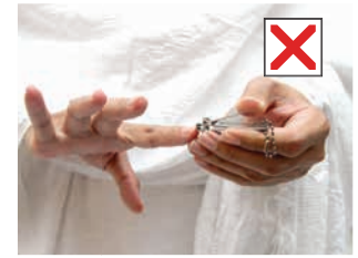
تقليم أظفار اليدين للمُحْرِم