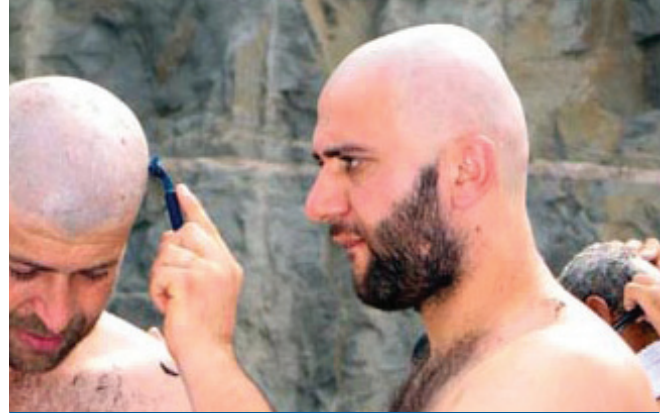
حلق الشعر للمُحْرِم

لقوله تعالى: ﴿وَلَا تَحْلِقُوا رُءُوسَكُمْ حَتَّىٰ يَبْلُغَ الْهَدْيُ مَحَلَّهُ﴾ [البقرة: ١٩٦]، ويشمل النهي شعر البدن كله، قياساً على شعر الرأس.