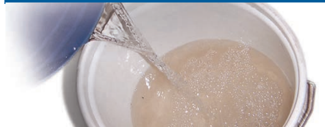
የውሃን መጠን በመጨመር ማጽዳት