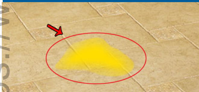
ፈሳሽ ነጃሳ መሬት ላይ