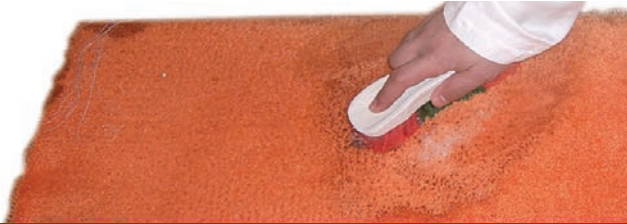
ምንጣፍ የሚጸዱበት መንገድ

ነጃሳው እስኪወገድ ድረስ በውሃ ይታጠባል፤ ወይም በዘመናዊ ማጽጃዎች በመፈገፈግም ይጸዳል።