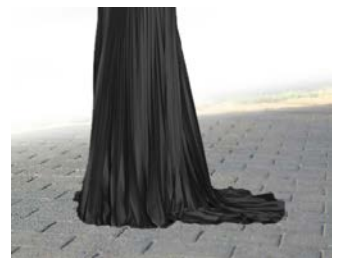
መሬት የሴትን ልብስ ያጸዳል

ረጅም የሴት ቀሚስ በጫፉ ላይ ነጃላ ቢጣበቅበት ንጹሕ በሆነው ቦታ መሄዳ ይበቃታል፤ መሬቱ ራሱ ያጸዳል። ነቢዩ صلی اللہ علیہ وسلم ፡- «ከኋላው ያለው ያጸዳል።»(6) ብለዋል።