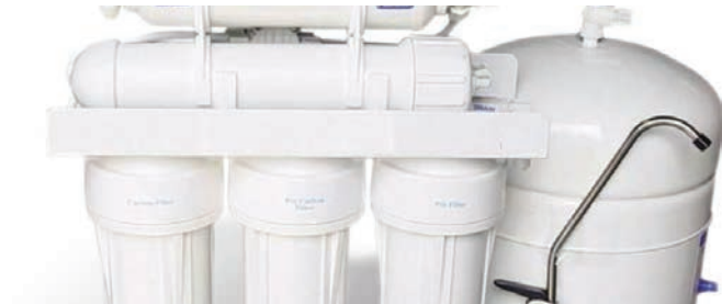
በዘመናዊ ዘዴዎች ማጽዳት

ነጃሳ የገባበት ውሃ ቅሪቱ እንዲወገድ የበዛ ውሃ በመጨመር ይጸዳል። በዘመናዊ የማጥሪያ ዘዴዎችም ሊጠራ ይችላል።