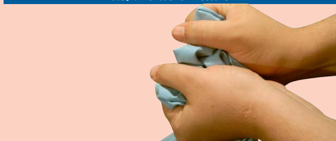
ደረቅ ከሆነ መፈግፈግ