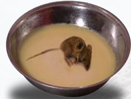
አይጥ ገብቶ የሞተበት ቅቤ

ነጃሳው ያለበትንና በዙሪያው ያለውን በማስወገድ ይጸዳል። ቀሪው በመሰረታዊ ንጽሕናው ላይ እንዳለ ይቀራል። የአላህ መልእክተኛ ﷺ :- «ቅቤ ውስጥ ስለ ወደቀች አይጥ ተጠይቀው «አስወጧትና በዙሪያዎ ያለውን አስወግዳችሁ ቅቤያችሁን ተመገቡ።» (1) ብለዋል።