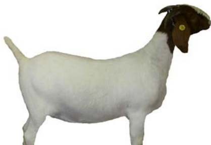
ሥጋው የሚበላ እንስሳ