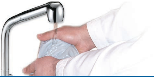
የሴት ሕጻን ሽንትን ማጠብ