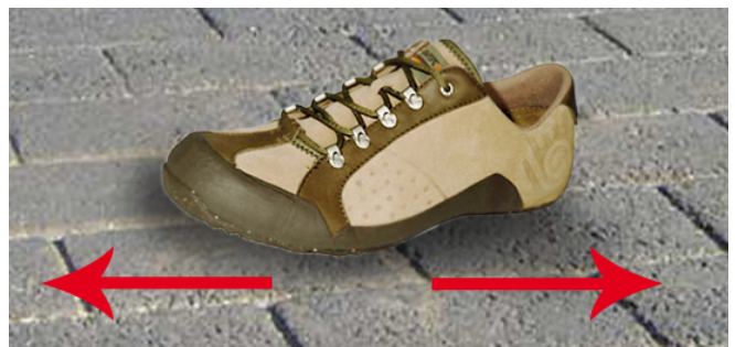
ጫማን መሬት ላይ በመጥረግ ማጽዳት

የነጃላው ቅሪት እስኪወገድ ድረስ መሬት ላይ በመፈገፈግ ይጸዳል። ነቢዩ صلی اللہ علیہ وسلم ፡- «አንዳችሁ በጫማው አዋኪ ነገር ከረገጠ አፈር (የነጃላ) መጽጃው ነው።»(5) ብለዋል።