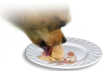
የውሻ ልጋግ (በምላሱ መልክፍ)

የውሻ መልክፍ ማለት ቢጠጣም ባይጠጣም በዕቃዎች ውስጥ ምላሱን አስገብቶ የመነካካቱ ሁኔታ ነው።