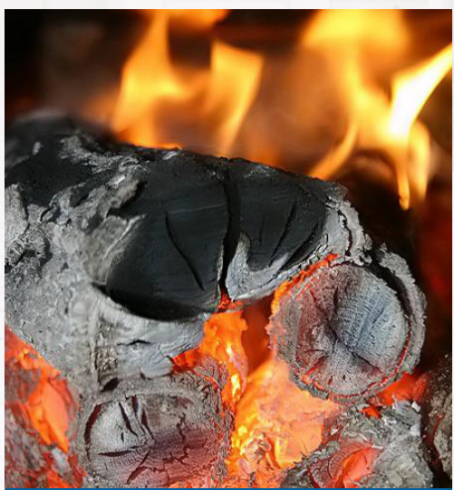
ፋንድያ ወደ አመድነት ሲለወጥ የጸዳ ያደርገዋል