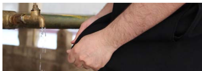
የተነጀሰ ልብስ የሚጸዱበት መንገድ

ነጃሳው እስኪወገድ ድረስ በውሃ ፈግፍጎ በማጠብና በመጭመቅ ይጸዳል።