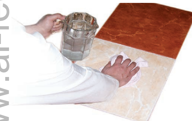
የውሃን መጠን በመጨመር ማጽዳት

መሬቱን የበከለው ፈሳሽ ነጃሳ ከሆነ በመድረቁ ብቻ መሬቱ የጸዳ ይሆናል። ይህም ከአቡ ቀላባ በተላለፈውና ፡-«መሬት ከደረቀ ጣህር (5) ሆኗል።» (6)