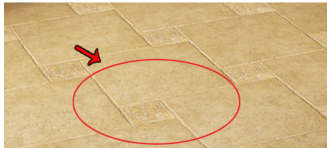
የፈሳሽ ነጃሳ መድረቅ