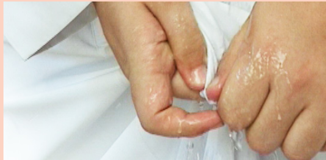
እርጥብ ከሆነ ማጠብ

«የአላህ መልእክተኛ صلی الله علیه وسلم መኒይ የነካውን ልብስ አጥቦው የታጠበውን ቦታ (እርጥቦቱን) በግይዜ እያየሁ በዚያው ልብስ ለሶላት ይሄዱ ነበር።» (1) ብለዋል። በሙስሊም ዘገባ ደግሞ «ከአላህ መልእክተኛ صلی الله علیه وسلم ልብስ ላይ በሚገባ ፈግፍጌ በዚያው ይሰግዱ ነበር።» (2) የሚል ተመልክቷል።