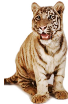
ሥጋው የማይበላ እንስሳ

በሕይወት እያለ በቁሙ ጣህር ቢሆን እንኳ፣ በሽሪዓዊ መንገድ መታረዱ ሐሳል የማይሆነው እንስሳ ቆዳ ቢለፋም ንጹሕ (ጣህር) አይሆንም።