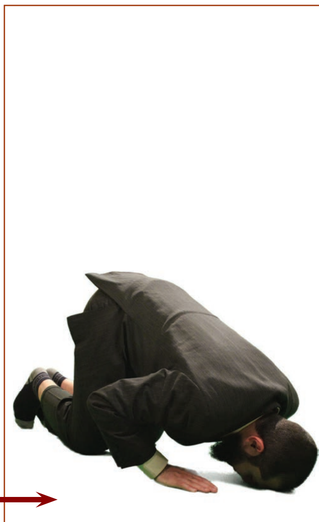
进行补误叩头——两次叩头

https://www.al-feqh.com/zh/弥补拜中失误的叩头、感谢安拉的叩头、诵读天经的叩头